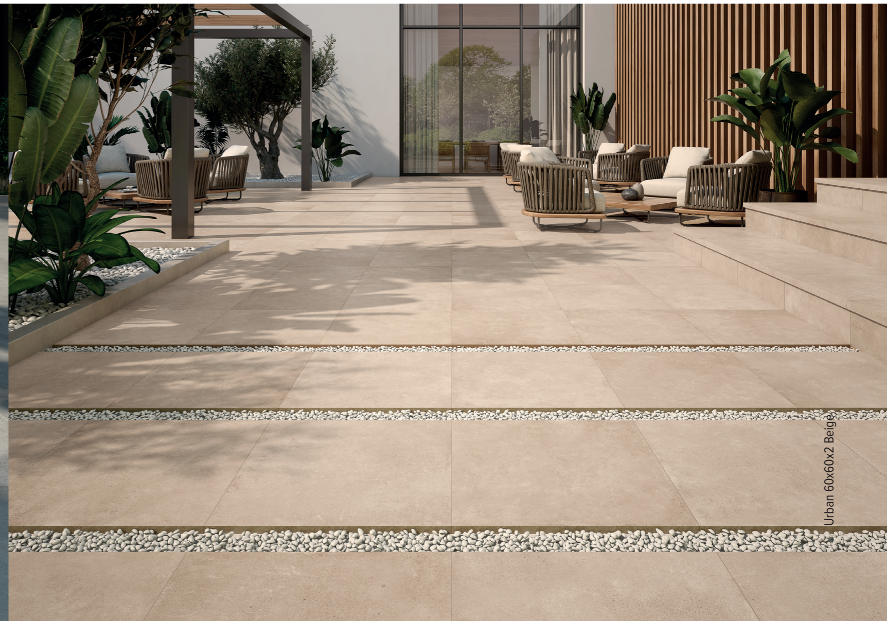
Urban 60x60x2 Beige