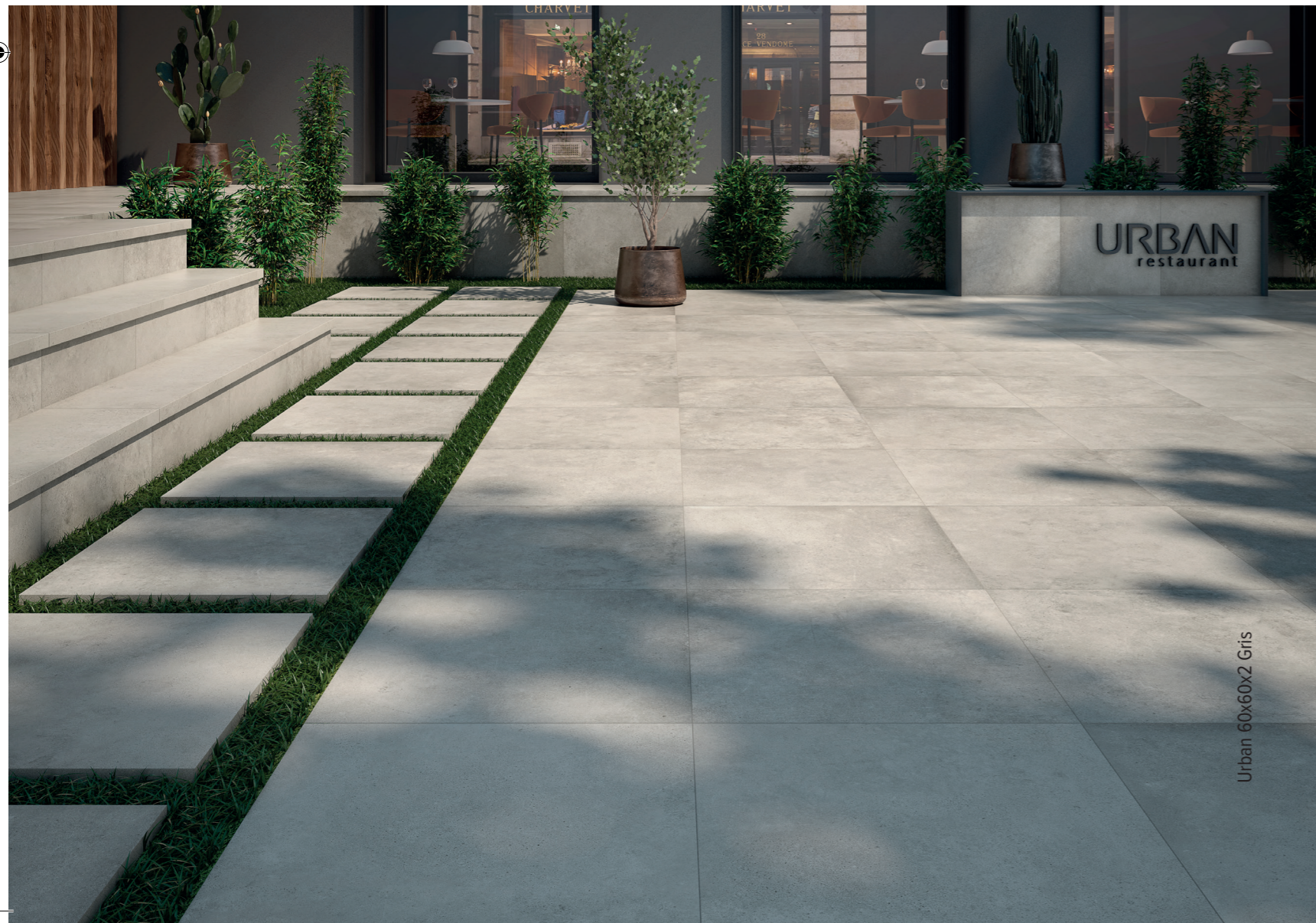
Urban 60x60x2 Gris